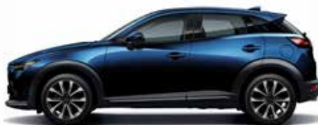
כחול קריסטל כהה (42M)