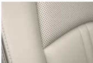
ריפוד עור לבן Pure White עם תפרים תואמים