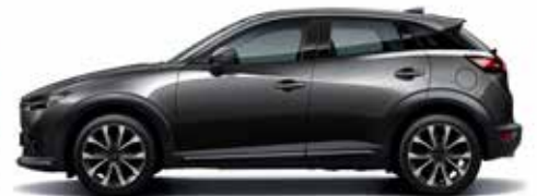
*אפור עשיר (46G)