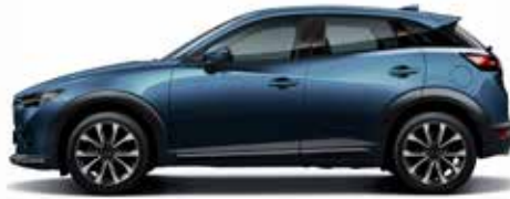
כחול נצחי (45B)