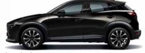
שחור סילון (41W)