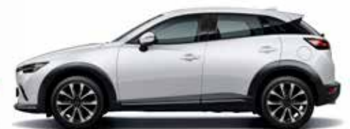
לבן פנינה (25D)

לתשומת ליבך! דוגמאות הצבעים, הריפודים והחישוקים מוצגות לשם המחשה בלבד. בשל מגבלות הדפוס, תתכנה סטיות מהצבעים והחומרים בפועל. מגוון הצבעים, החישוקים והחומרים כפוף לשינויים על-פי מדיניות היצרן ולמגבלות המלאי. פנה לנציג מכירות לקבלת מידע עדכני.