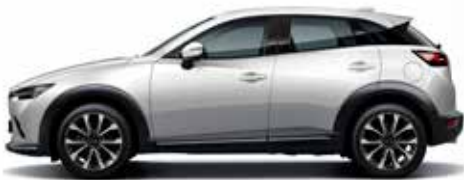
לבן קרמי (47A)