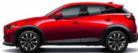
*אדום עשיר נוצץ (46V)